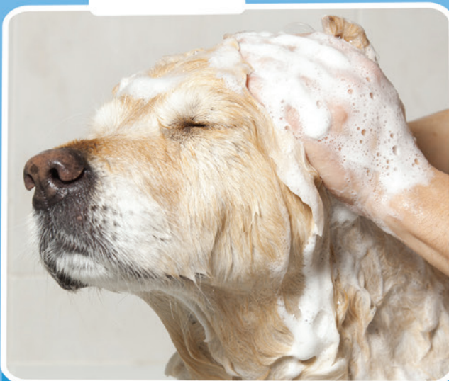
Paré pour la toilette

Bulletin à renvoyer à : Info-Journal Junior – Fondation Brigitte Bardot – 28, rue Vineuse 75116 Paris