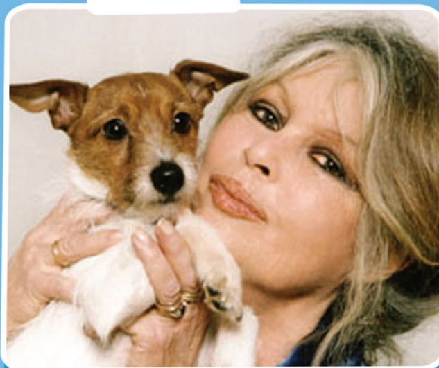
Adoption mode d'emploi