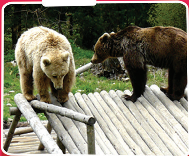
Le sanctuaire des ours dansants